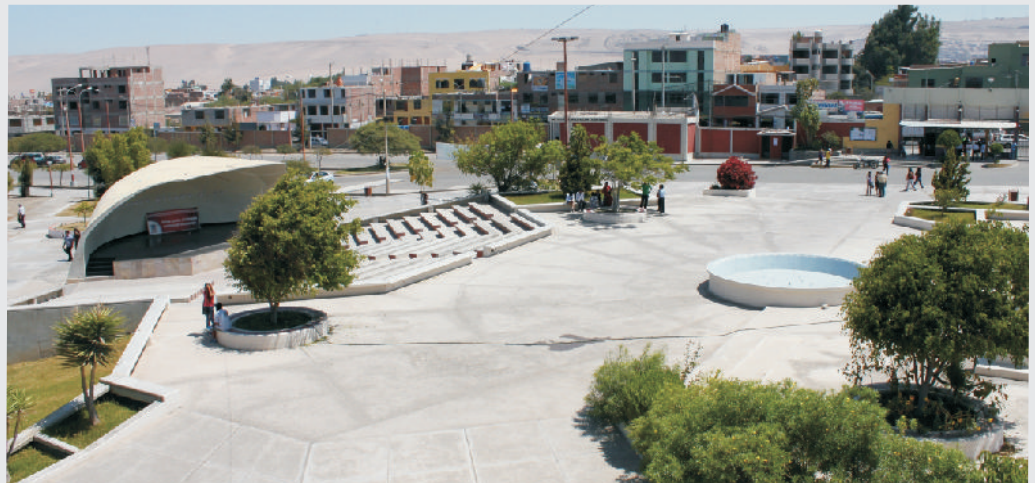
Actividad se desarrollará en las instalaciones de la Universidad Nacional Jorge Basadre Grohmann.

El Consejo Regional Interuniversitario del Sur (CRISUR), organismo que reúne a universidades públicas y privadas del sur peruano, aprobó por consenso la organización y ejecución del Foro Regional Universitario denominado “La Universidad en el Siglo XXI, la nueva Ley Universitaria y su Autonomía”; evento que se desarrollará en el campus de la ciudad universitaria “Los Granados” de la Universidad Nacional Jorge Basadre Grohmann de Tacna, los días 01 y 02 de octubre. En el que cuenta con la siguiente programación: