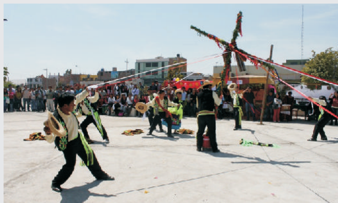
CRONOGRAMA DE JUEGOS FLORALES DE 10:00 A 14:00 HORAS:

Los juegos florales en su décima segunda temporada son un evento cultural con trascendencia local y regional en donde la juventud de nuestra casa superior de estudios participa demostrando su talentos en las diferentes actividades artísticas que se ejecutan y tiene como objetivo principal fomentar, difundir los valores artísticos culturales, revalorar las costumbres tradicionales de la música, la danza, artes plásticas y las diferentes formas artísticas como el lenguaje y comportamiento de nuestra cultura popular.