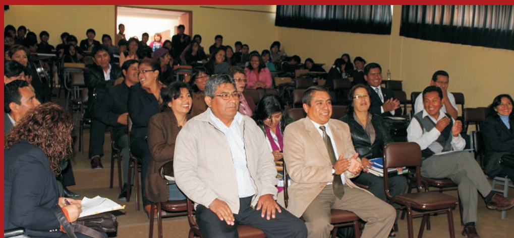
Docentes de la E.A.P. de Educación de la Facultad de Educación, Comunicación y Humanidades.

“No es mejor maestro el que sabe más, sino el que mejor enseña”.