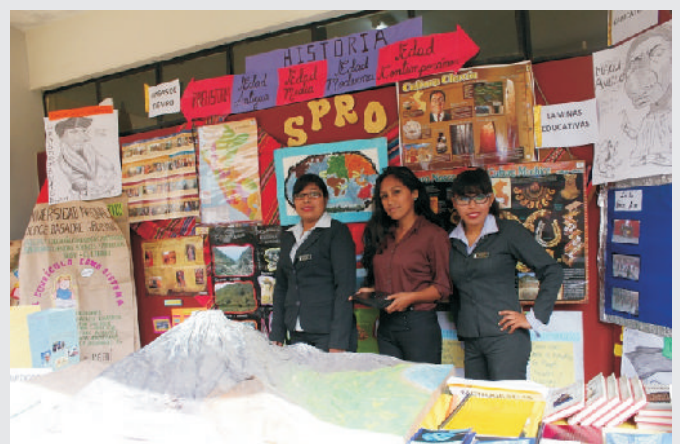
Actividad se desarrolló en el frontis de la E.A.P. de Educación.

La exposición del material educativo tuvo como objetivo crear entornos pedagógicos, dinámicos y creativos, que