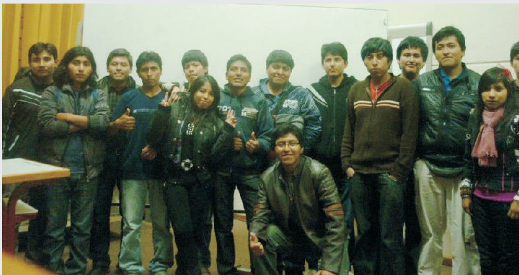
Estudiantes de la E.A.P. de Ingeniería en Informática y Sistemas.