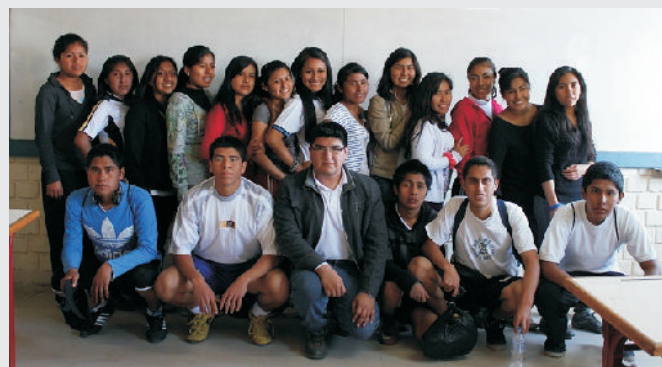
Estudiantes del primer año académico de estudio.